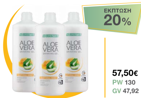
LR LIFETAKT AV Drinking Gel Traditional Honey 3 μπουκάλια / μήνα • κωδ. 2780000