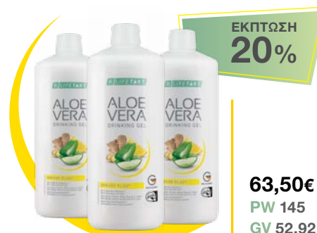
LR LIFETAKT AV Drinking Gel Immune Plus 3 μπουκάλια / μήνα • κωδ. 2780004