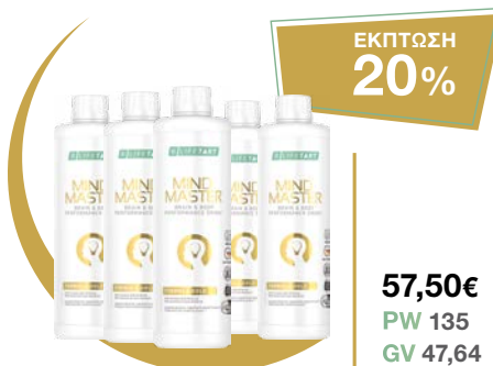
LR LIFETAKT Mind Master GOLD FORMULA κωδ. 2780008 5 μπουκάλια / μήνα