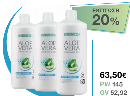
LR LIFETAKT AV Drinking Gel Active Freedom 3 μπουκάλια / μήνα • κωδ. 2780003