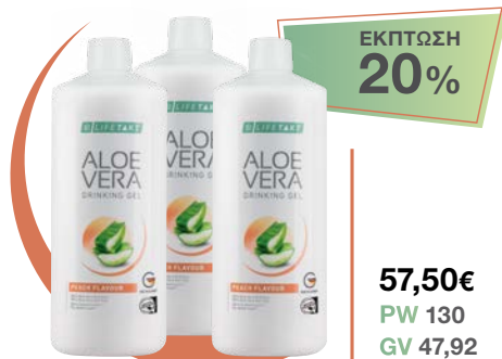
LR LIFETAKT AV Drinking Gel Peach Flavour 3 μπουκάλια / μήνα • κωδ. 2780001