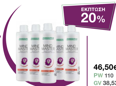
LR LIFETAKT Mind Master RED FORMULA κωδ. 2780007 GREEN FORMULA κωδ. 2780006 5 μπουκάλια / μήνα