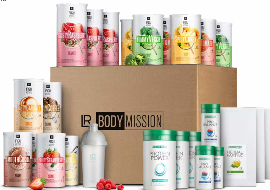
Ενδεικτική απεικόνιση γεύσεων των γευμάτων LR FIGUACTIVE

• online υποστήριξη στο site: www.body-mission.com