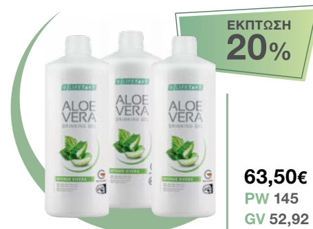
LR LIFETAKT AV Drinking Gel Intense Sivera 3 μπουκάλια / μήνα • κωδ. 2780002